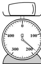
Diagram 3 Rajah 3

What is the mass of the packet of sugar in g? Berapakah jisim peket gula itu dalam g?